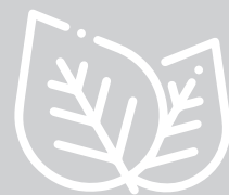
Sekundäre Pflanzenstoffe (Superfoods)